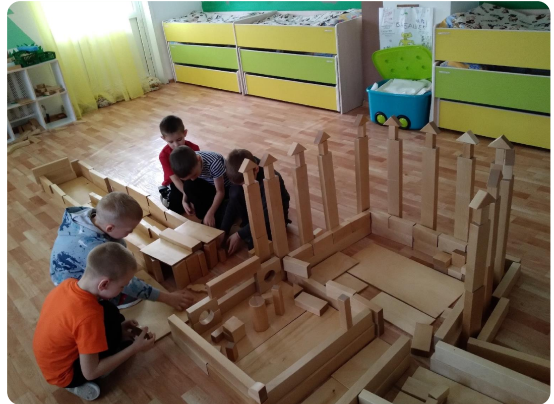
Спальня — пространство для игры