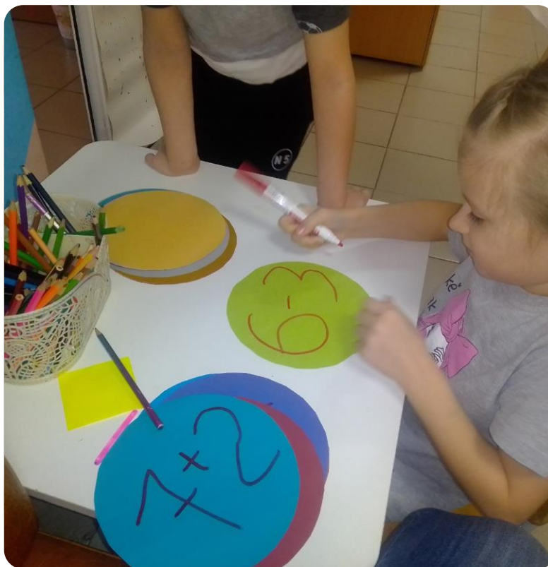
Продукты детской деятельности