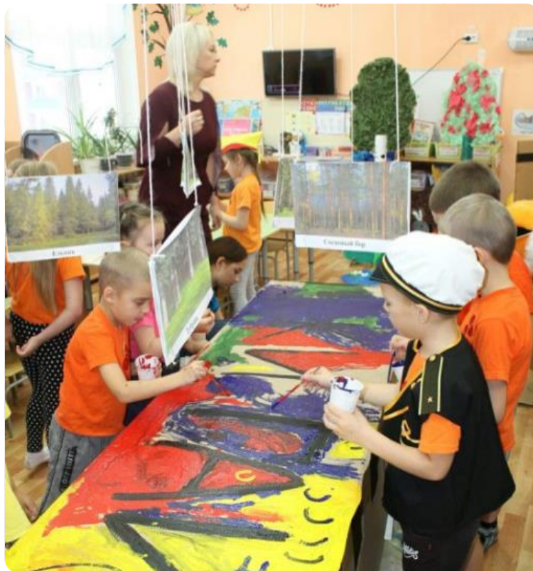
Среда группы, отражающая тему проекта