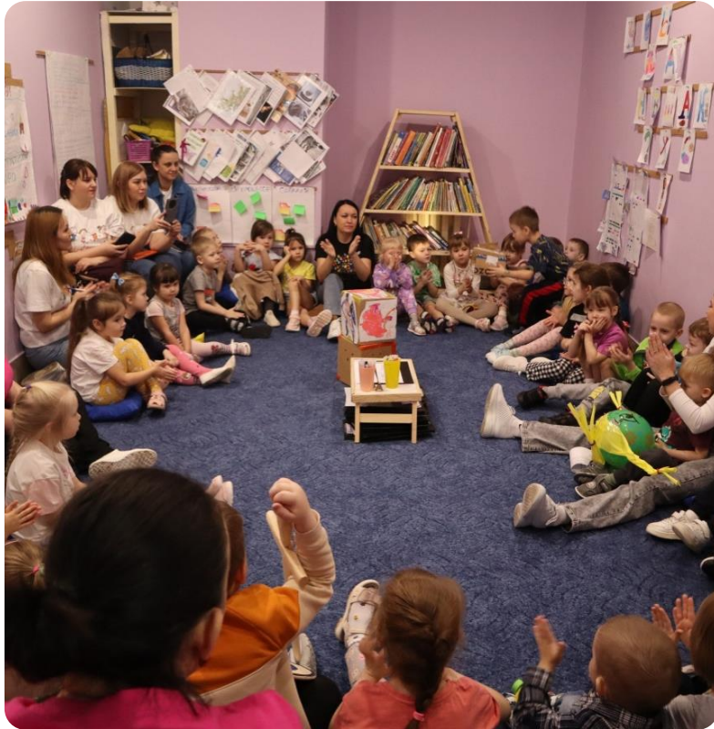
Общение на равных