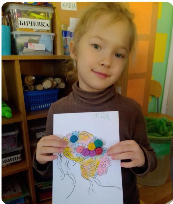
Быстро меняющиеся элементы