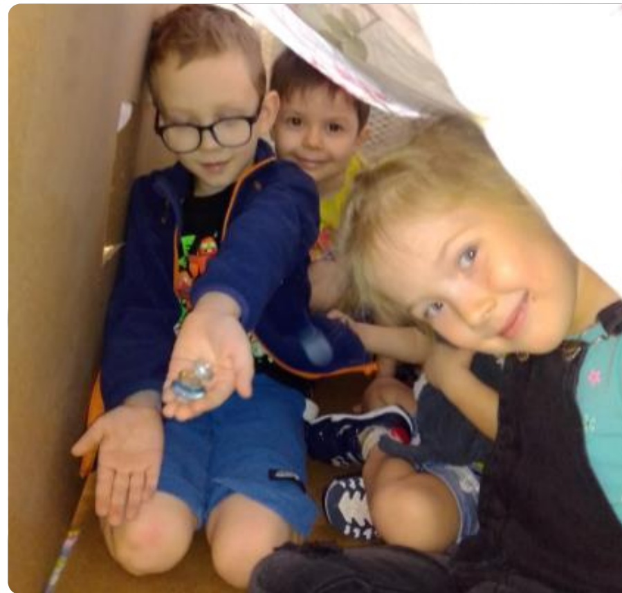
Пространство для детей