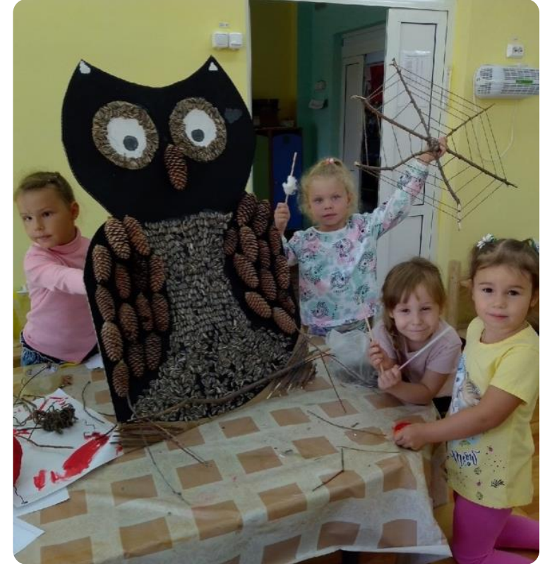
«Я научился, я смогу научить и тебя»