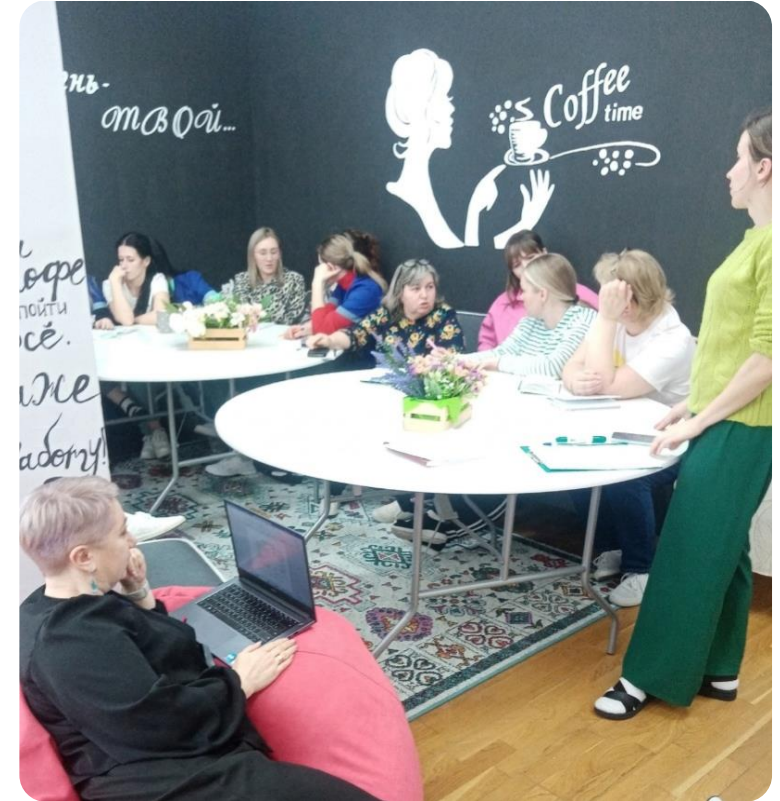
Детский сад — территория, комфортная для всех