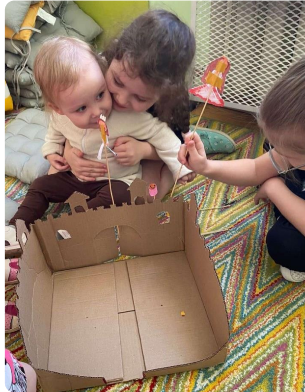
Дети — детям