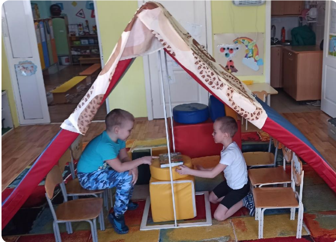
Принятие свободной игры